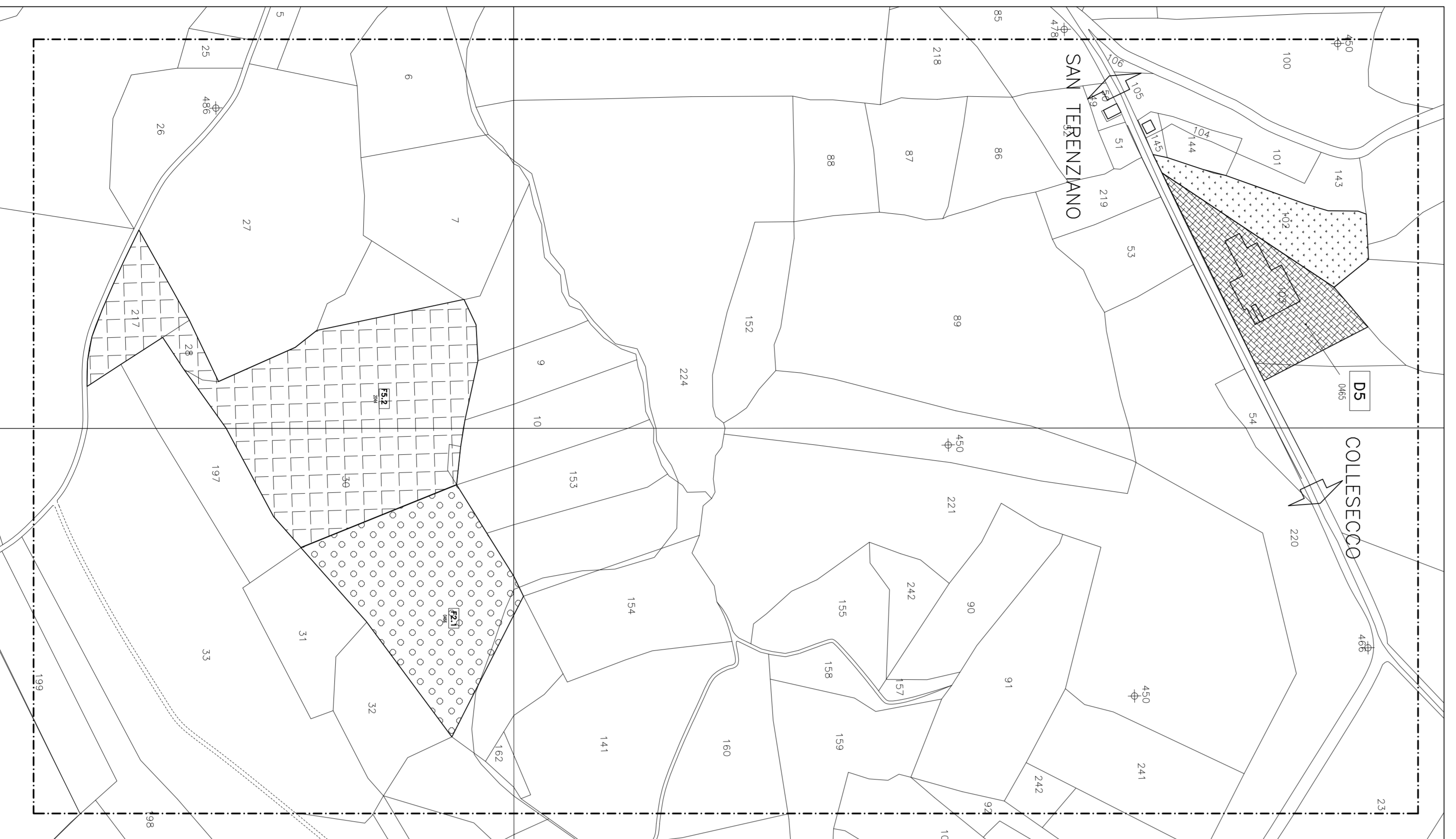
b - FONTE PELLATA fogli 49, 50, 66 elementi 323101, 323102, 323113, 323114