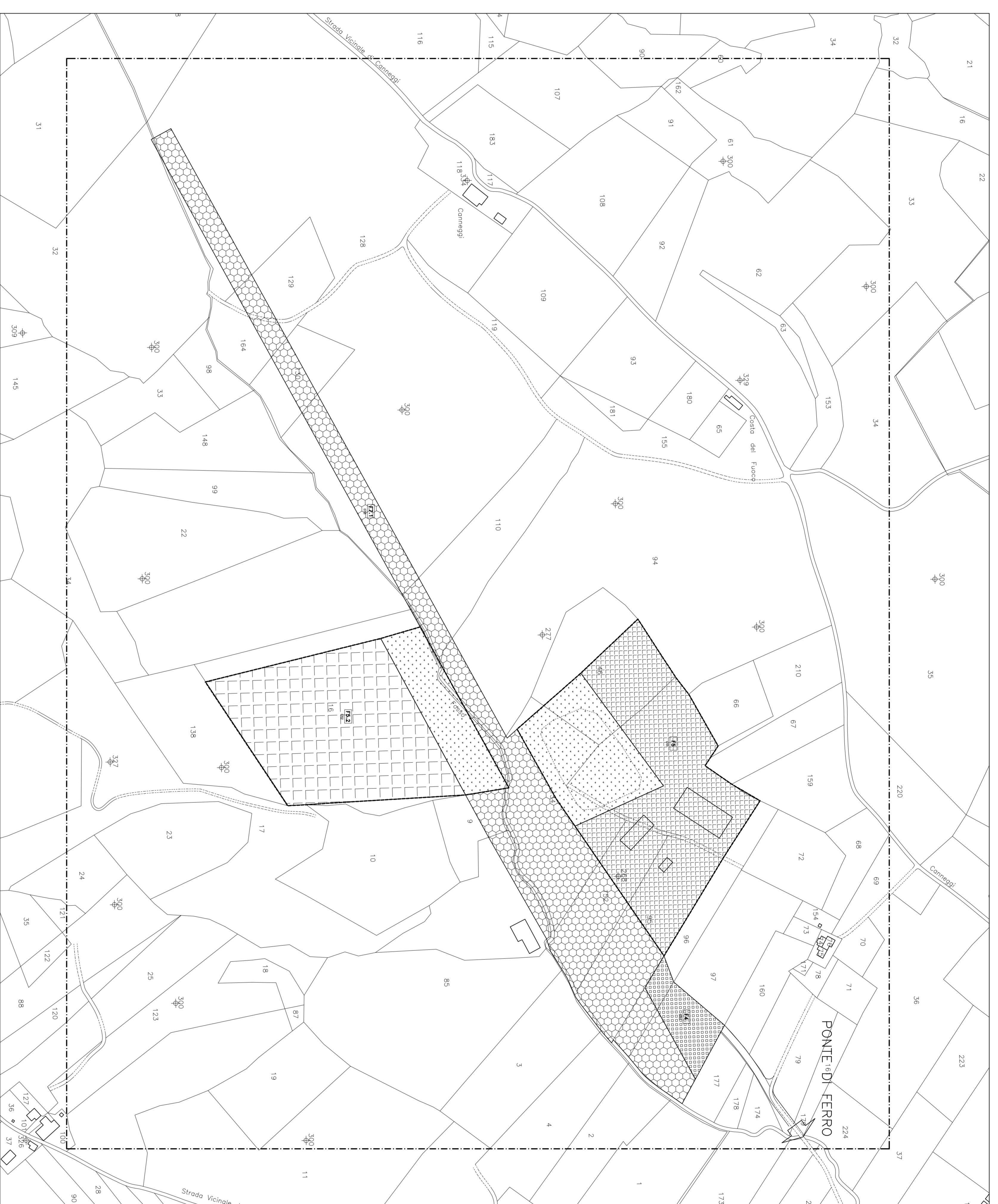
o - Ponte di Ferro - Acquarossa fogli 52, 54 elemento 323114