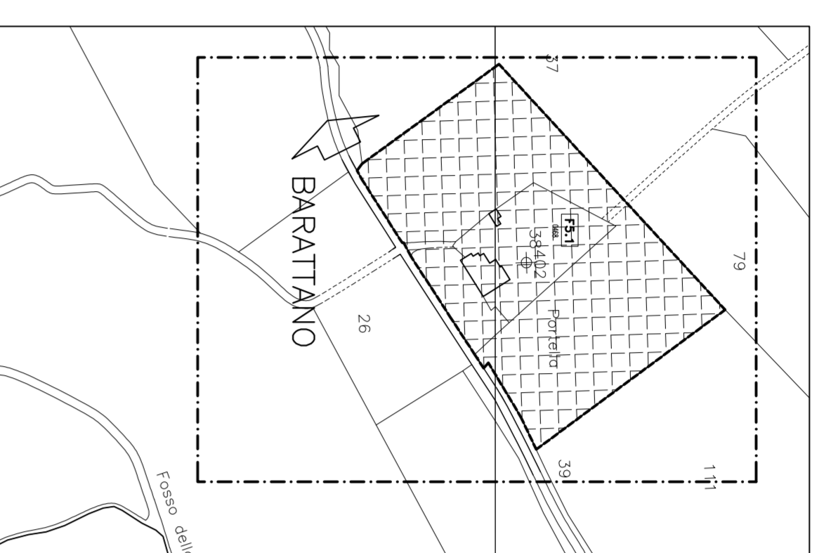
d - La Portella foglio 83 elementi 323113, 323154